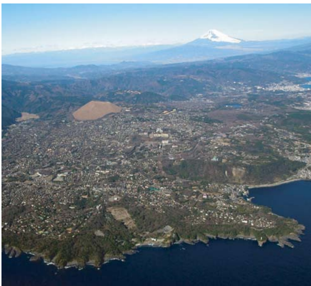
大室山と城ヶ崎海岸

ユネスコが支援する「ジオパーク」は、地域の地質学的歴史とそれに関わる人間社会をテーマとした経済・文化活動を展開し、それによって地域の振興と再生をめざすという壮大なプロジェクトである。伊豆半島でも今年3月に地元7市6町が推進協議会を設置し、認定のための本格的な活動を開始した。その構想や現状を紹介する。