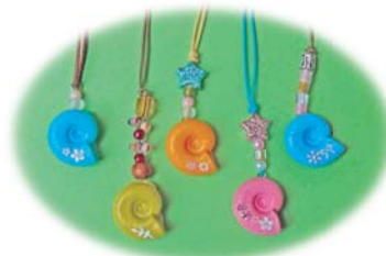
アンモナイトアクセサリ